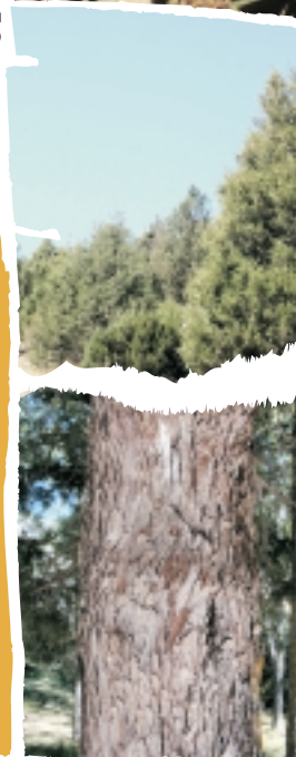
ENEBRO (SABINA EN EL RESTO DE ESPAÑA)